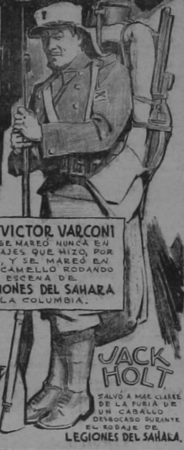
VICTOR VARCONI NO SE MAREÓ NUNCA EN 9 VIAJES QUE HIZO, POR MAR, Y SE MAREÓ EN UN CAMELLO RODANDO UNA ESCENA DE LEGIONES DEL SAHARA DE LA COLUMBIA.