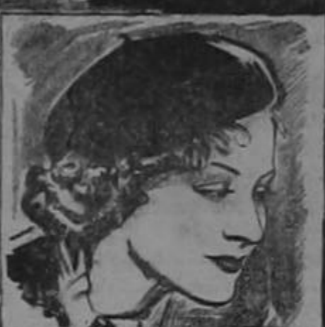
EL PRIMER EMPLEO DE MAE CLARKE FUE EL DE VENDER CHORIZOS ALEMANES.