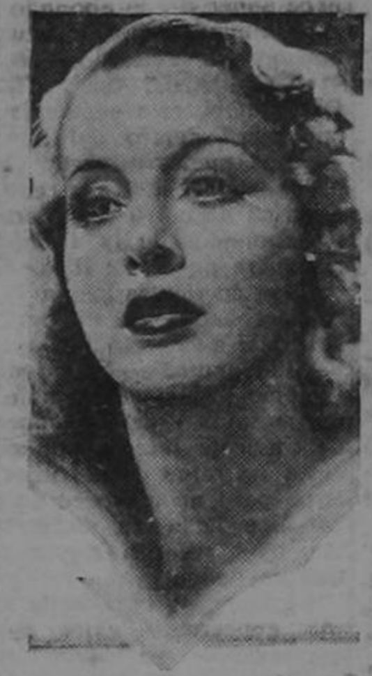
JOAN PERRY, en su rol de hija única y millonaria, víctima de mal hechores. . . en el film Columbia "EL FALSO SECUESTRO".

Lea y anúnciese Ud. en La Voz del Atlántico